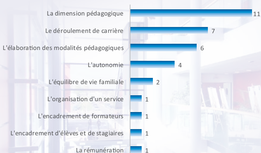
Graphique 2 : Première motivation à devenir formateur/responsable de formation – Effectifs

Les stagiaires sont tout d'abord attirés par l'aspect pédagogique de leur futur métier (dimension pédagogique pour les formateurs et élaboration des modalités pédagogiques pour les responsables de formation) avant de citer, en deuxième motivation, le déroulement de carrière, aspect plus utilitaire.