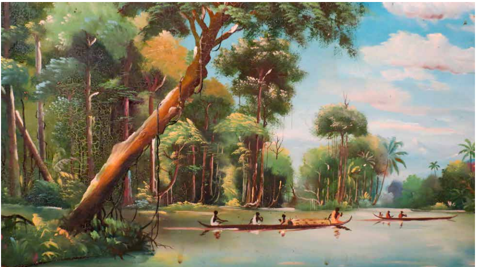
GRILLY (Louis), Pirogues , titre factice, huile sur toile, 45 x 35 cm, fonds Énap.

Ce dessin représente l'île du Diable, dix ans avant l'arrivée du capitaine Dreyfus. L'île du Diable ne posséda jamais que deux ou trois petits bâtiments et humbles cases. Deux surveillants vivaient à demeure, et l'île ne fut réservée aux déportés politiques qu'à partir des années 1890.