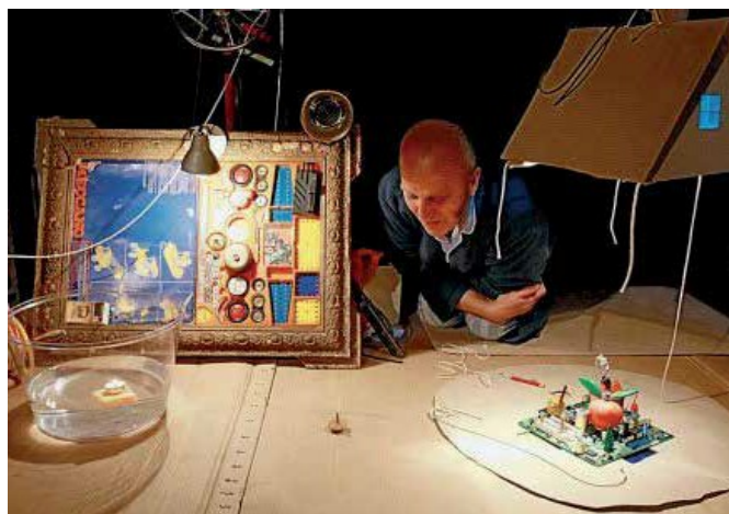
Spectacle « La mécanique des papas » dans le cadre du cours des CPIP sur le maintien des liens familiaux – janvier 2013