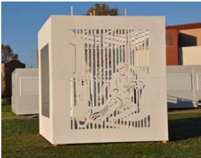
Sculpture éphémère dans le cadre du projet avec le collectif P4 autour des œuvres du Louvre