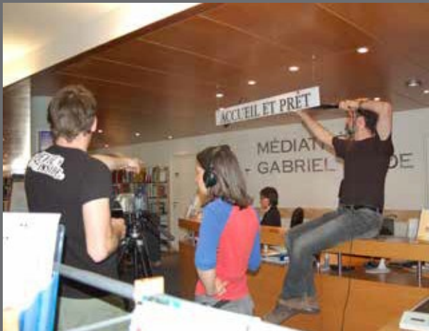
Tournage d'un film dans le cadre d'un projet d'élèves à la médiathèque Gabriel Tarde – 2010