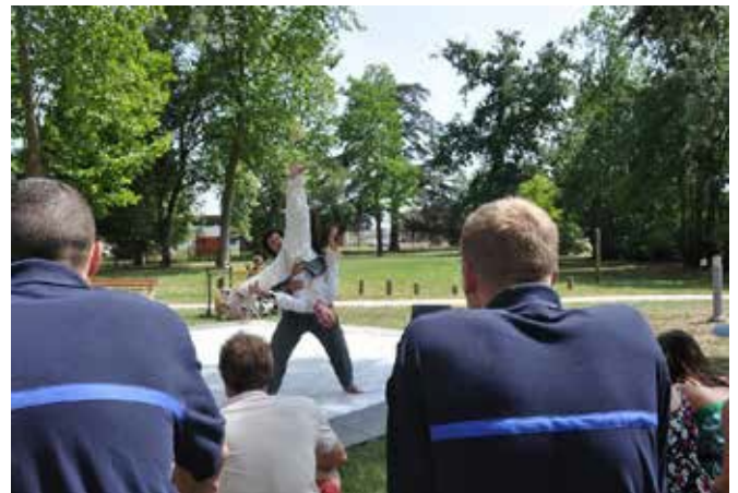
Spectacle « Moyen Plume » juillet 2010

Au sein de l'Énap il n'existe pas de lieux dédiés aux spectacles et à toutes autres actions culturelles. Deux catégories de lieux se dégagent et touchent des publics différents.