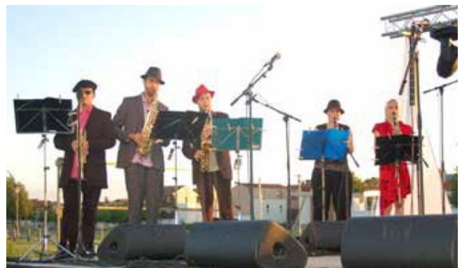
Concert des élèves CPIP 14 – juin 2010

moments qui permettent de travailler sur leur propre identité, l'image et la confiance en soi (peinture, musique, lecture, création de clip, light painting...). Des médiations culturelles sont régulièrement programmées à destination des personnels de l'école.