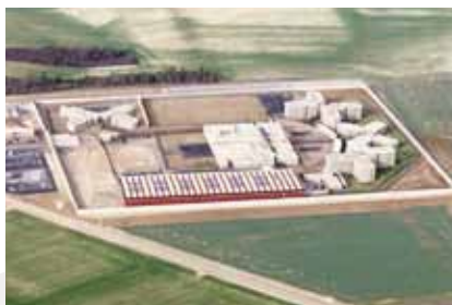
CD de Bapaume vers 1990 (APNET)