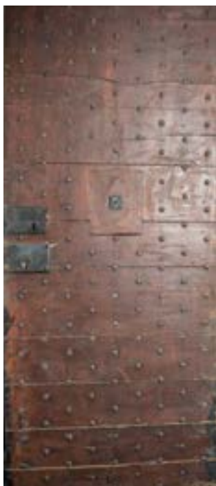
MA d'Agen, C. Preleur, 2018, coll. Centre de ressources sur l'histoire des crimes et peines