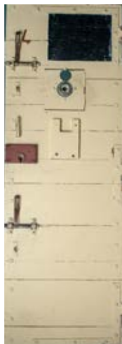
Paris la Santé, C. Preleur, 2018, coll. Centre de ressources sur l'histoire des crimes et peines