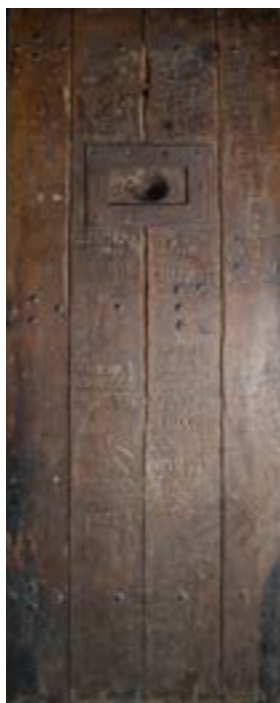
MC Clairvaux, C. Preleur, 2018, coll. Centre de ressources sur l'histoire des crimes et peines

*Récolement : Vérification et pointage des objets sur l'inventaire des objets patrimoniaux.