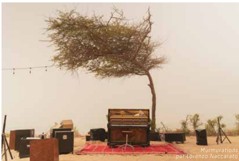
Murmurations par Lorenzo Naccarato