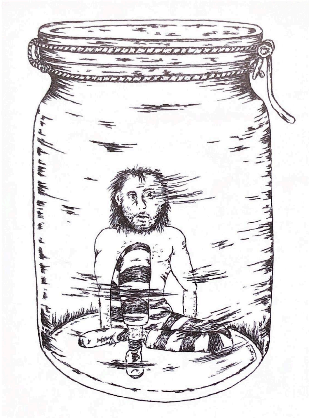
FINNEISEN G., Réclusion en isolement , 2018, Allemagne, Dessin, Collection privée.