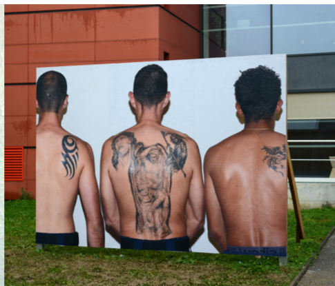
Life is a battlefield (2016) travail avec l'implication d'élèves de la 189 ème promotion d'élèves surveillants