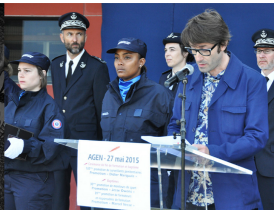
Un bleu parmi les bleus (2015) discours à la 187 ème promotion d'élèves surveillants