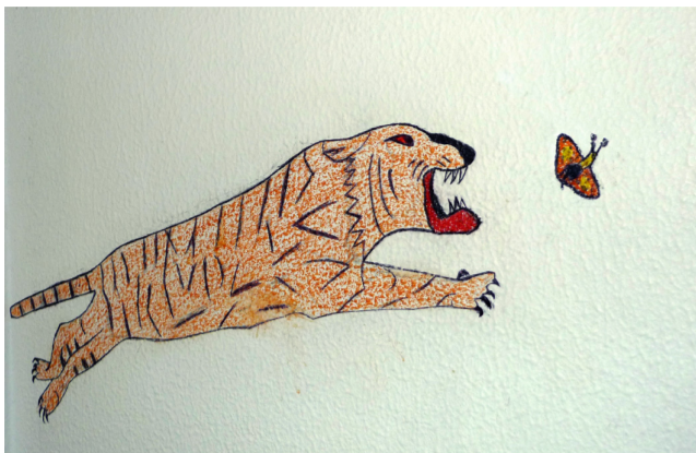
Le tigre et le papillon (2012) vue d'un dessin dans une cellule vidée, Maison d'arrêt de Nantes

Épisode 4 du projet artistique d'Arnaud Théval janvier 2016 à l'Énap.