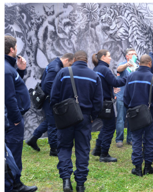
Never stop dreaming (2016) vue du vernissage, travail avec l'implication d'élèves de la 189 ème promotion d'élèves surveillants

familial ou comme un slogan d'une ligne de conduite à tenir. Ils me racontent, c'est émouvant, touchant de comprendre ces dessins parfois abstraits, le sens qu'ils y mettent.