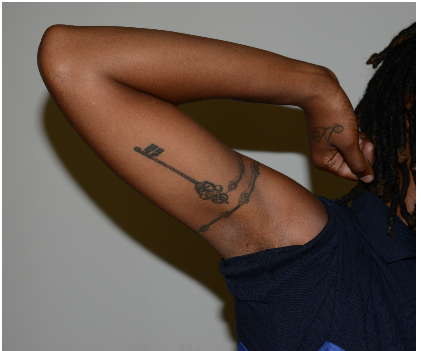
Beyond the skin (2016) détail, travail avec l'implication d'élèves de la 189 ème promotion d'élèves surveillants