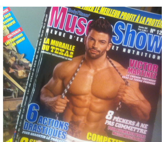
Couverture d'un magazine de musculation, Énap (2015)