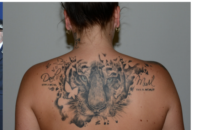
Un tigre et des papillons (2016) travail avec l'implication d'élèves de la 180 ème promotion d'élèves surveillants