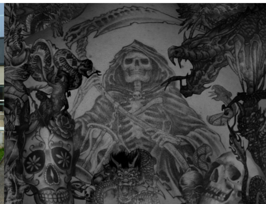
Don't stop dreaming (2016) travail avec l'implication d'élèves de la 189 ème promotion d'élèves surveillants