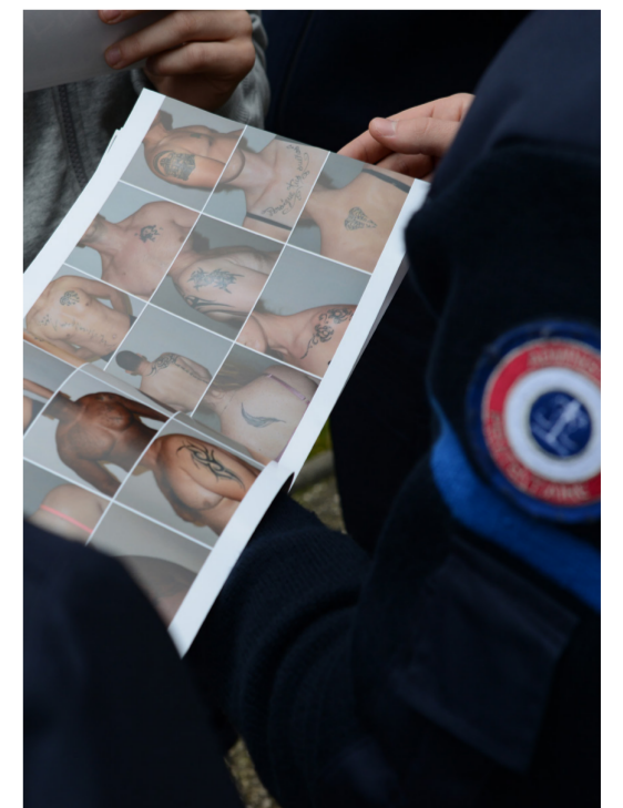
Distribution du livret «édition limitée» (2016)