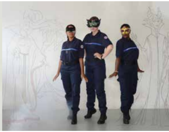
Les fantômes (2015) travail avec l'implication d'élèves de la 188 ème promotion d'élèves surveillantes