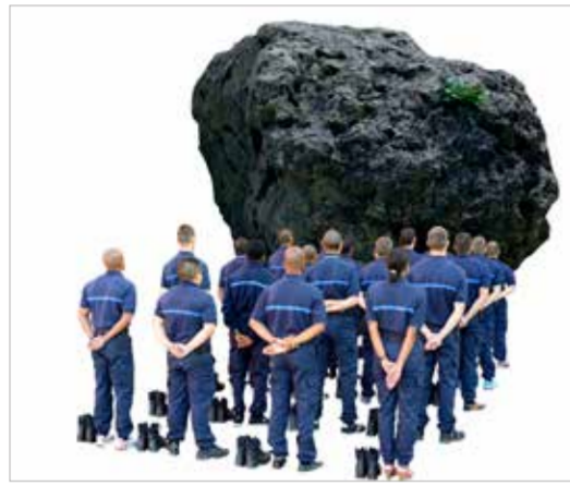
La convocation (2014) travail avec l'implication d'élèves de la 187 ème promotion d'élèves surveillantes

Épisode 3 du projet artistique d'Arnaud Théval_2015 à l'Énap.