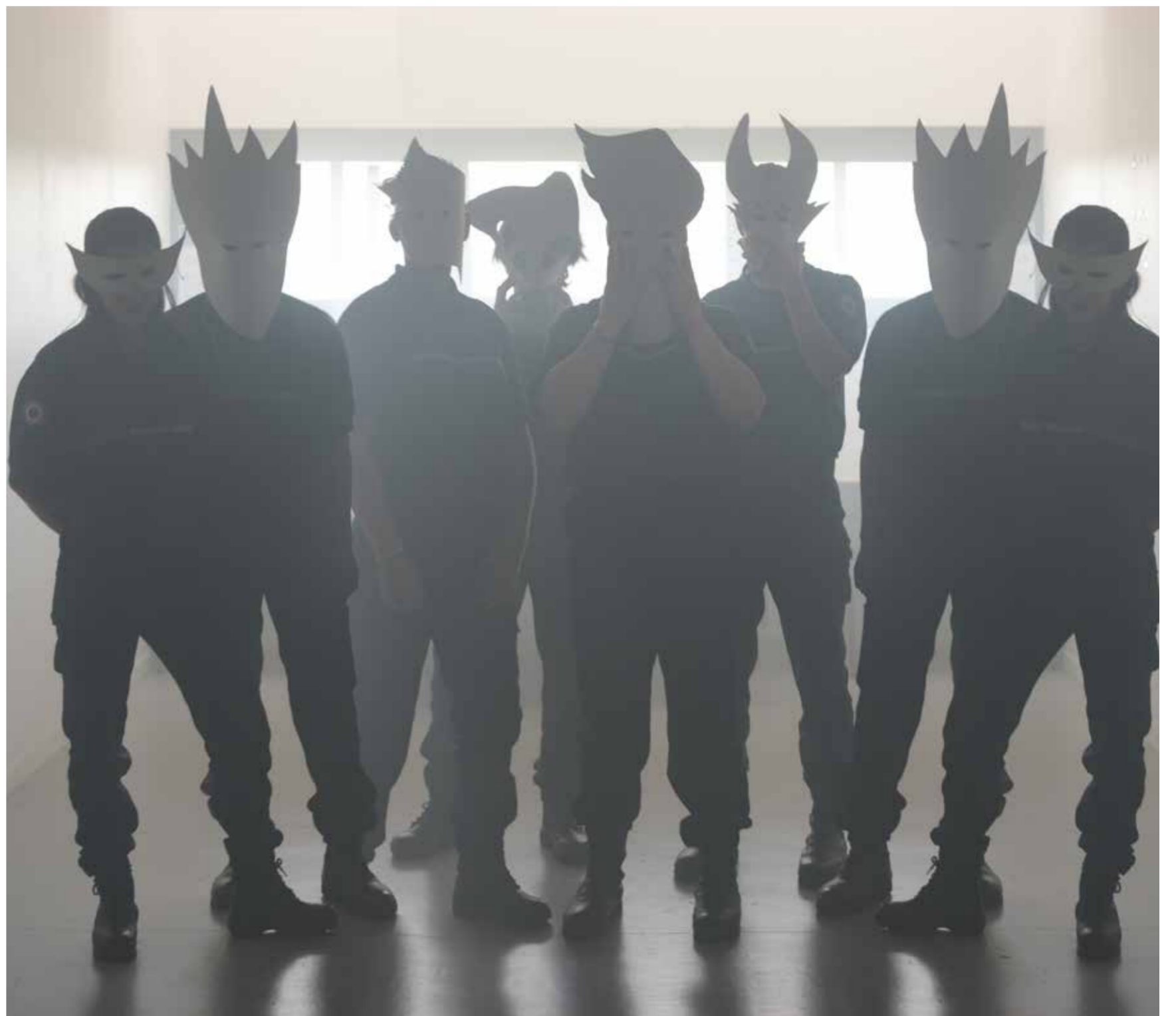
Le soupçon du bourreau (2015), détail, travail avec la 188 ème promotion d'élèves surveillantes