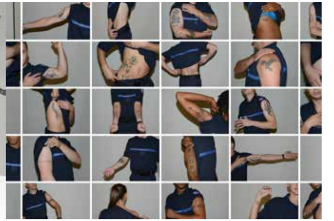
Beyond the skin (2016) travail avec l'implication d'élèves de la 189 ème promotion d'élèves surveillantes