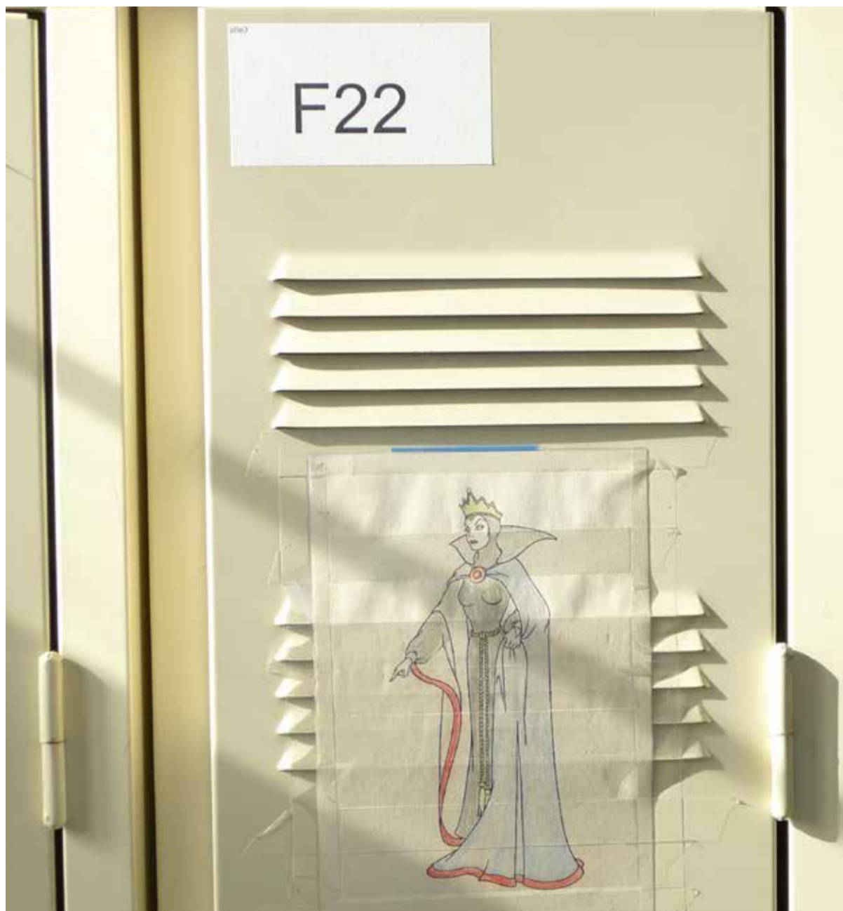
Photo d'un casier dans le vestiaire des femmes, Maison d'arrêt de Nantes (2012).