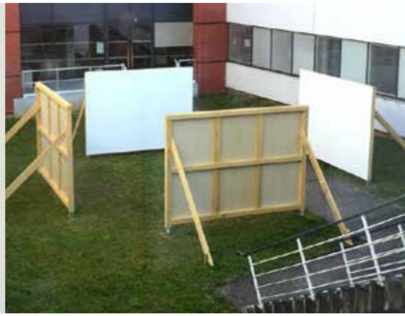
La place du tigre et du papillon (2015)