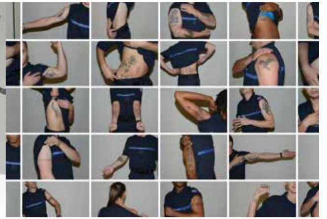
Beyond the skin (2016) travail avec l'implication d'élèves de la 189 ème promotion d'élèves surveillants