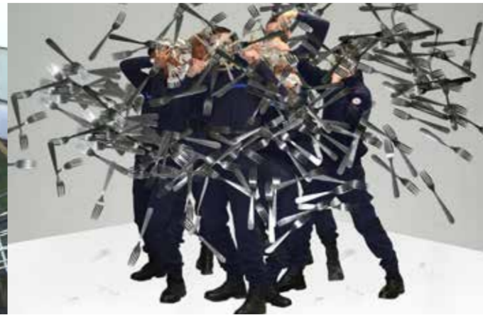
Scène à la fourchette (2015) travail avec l'implication d'élèves de la 187 ème promotion d'élèves surveillants