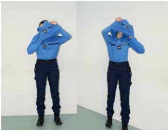
Une emprise totale (2016) travail avec l'implication d'élèves lieutenants de 20 ème promotion