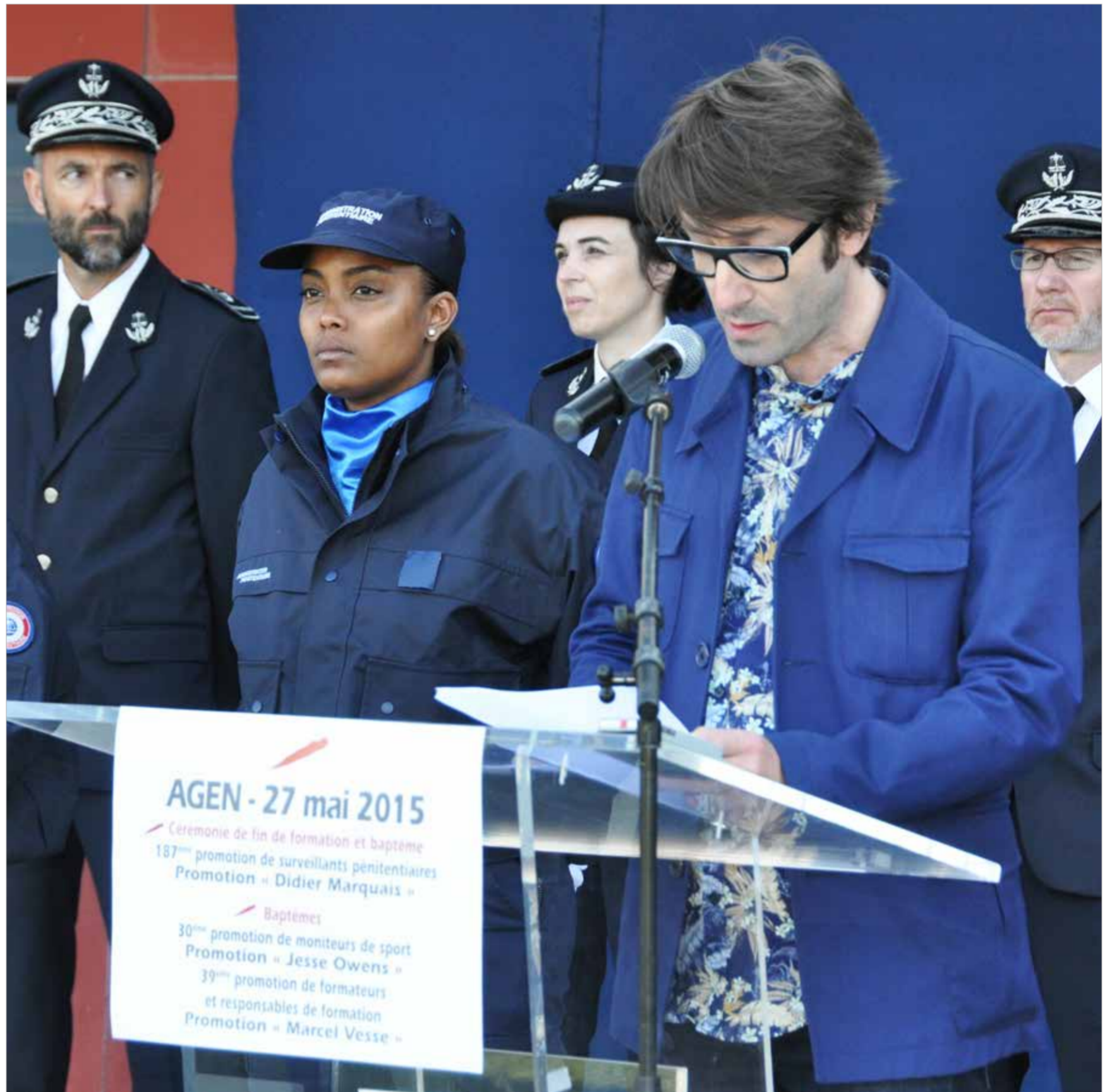
Un bleu parmi les bleus (2015) discours à la 187 ème promotion d'élèves surveillants