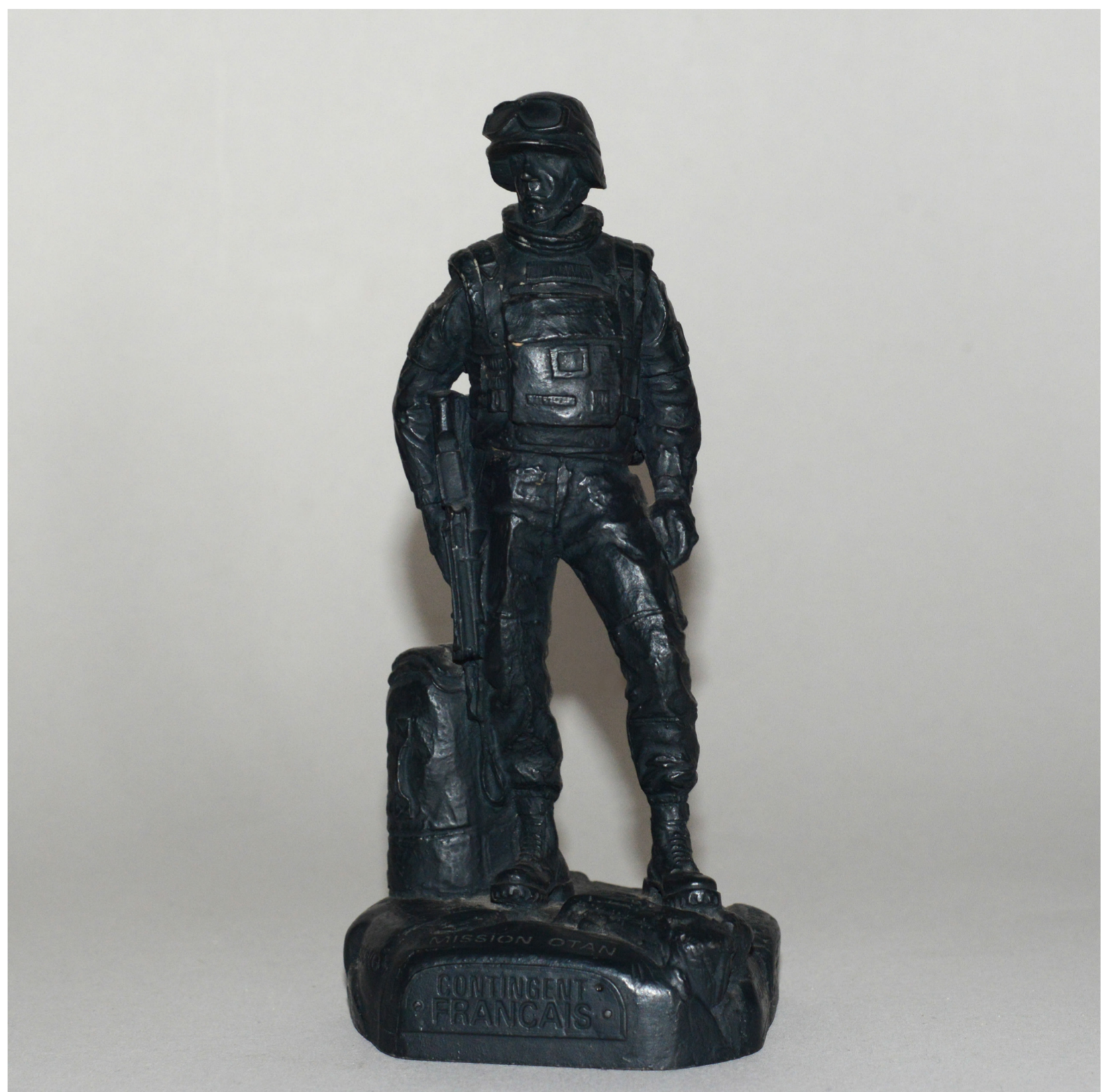
Les liens de l'émancipation (2016) détail, travail avec l'implication des élèves surveillants de la 190 ème promotion.

La durée de distribution des uniformes a été rallongée et le temps d'essayage s'étire parfois très longtemps après que le premier de chaque groupe ait fini de revêtir son uniforme et attend avec les autres que les derniers arrivent. Ils attendent en blaguant, ils ne sont pas pressés, ils sont là pour huit mois. Je discute avec eux de mes travaux, de leurs pays et soudain l'un d'entre eux me demande s'il a le temps d'aller chercher les colliers de coquillages qu'il a dans sa valise.