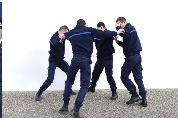
Scène au sifflet (2015) travail avec l'implication d'élèves de la 187 ème promotion d'élèves surveillants