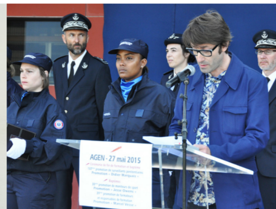
Un bleu parmi les bleus (2015) discours à la 187 ème promotion d'élèves surveillants