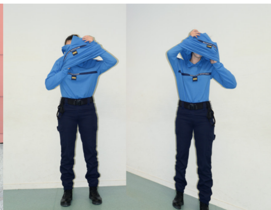
Une emprise totale (2016) travail avec l'implication d'élèves lieutenants de 20 ème promotion