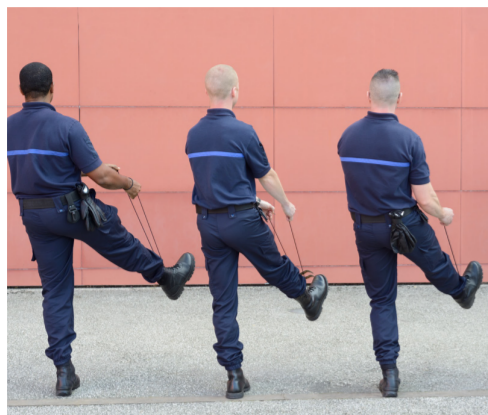
Le mur rouge (2014) - détail -travail avec l'implication d'élèves de la 187 ème promotion d'élèves surveillants

Épisode 6 du projet artistique d'Arnaud Théval_ octobre 2016 à l'Énap.