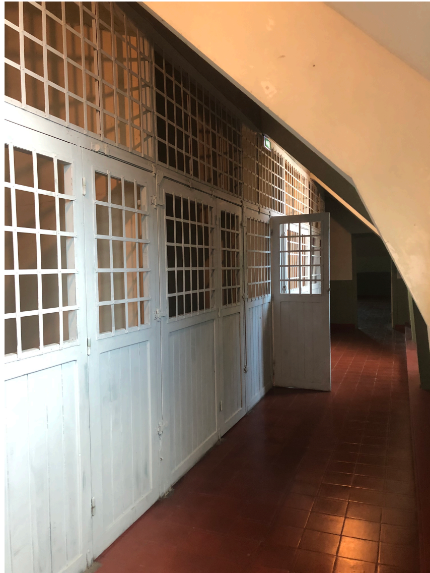
Photographie des « cages à poules », prise à l'exposition permanente du musée du Château Ducal de Cadillac, visitée le 19 février 2020.