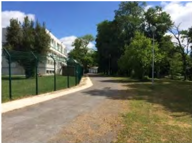
Photo de l'entrée du CEF divisant le lieu de vie à droite sur l'image du lieu d'insertion situé au fond à gauche.