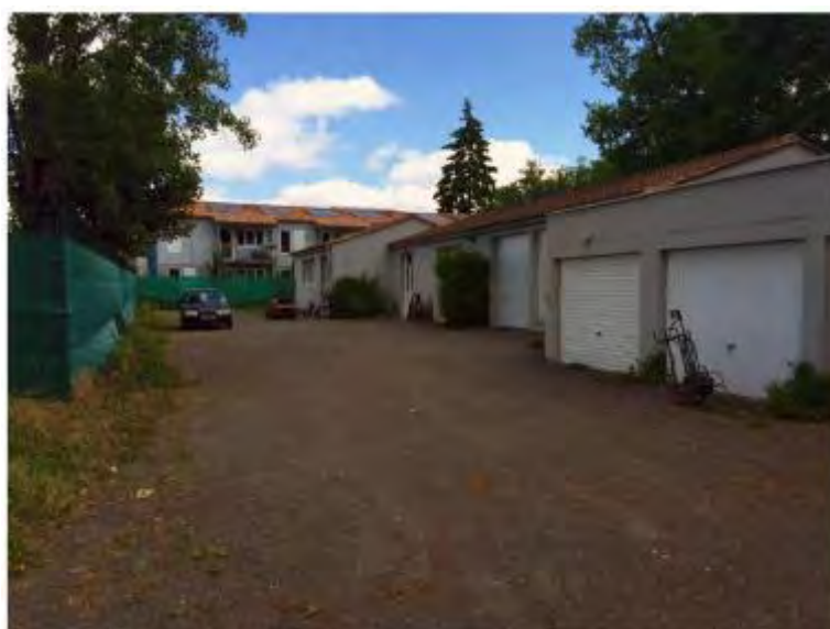
Photo des salles d'atelier (musculature, classe...) et d'insertion.