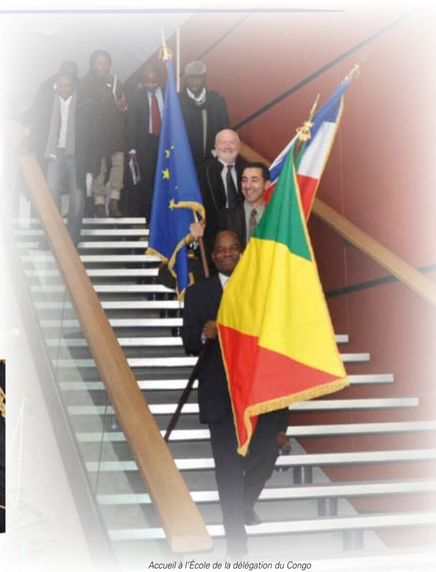
Accueil à l'École de la délégation du Congo