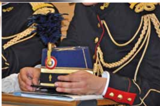
Accueil à l'École des élèves officiers de la gendarmerie nationale