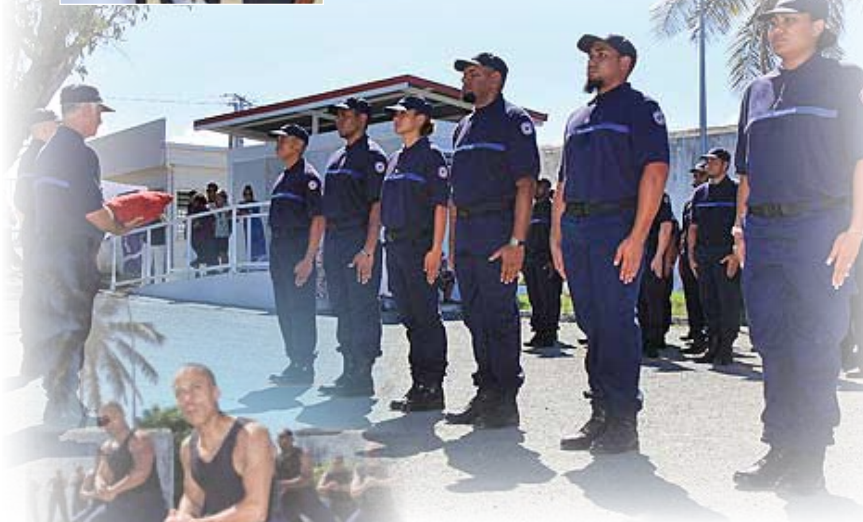
Promotion « Uéva Timiona »

Les cérémonies se sont achevées par un haka interprété par les surveillants stagiaires.