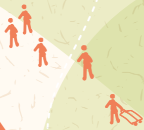
Photo de famille