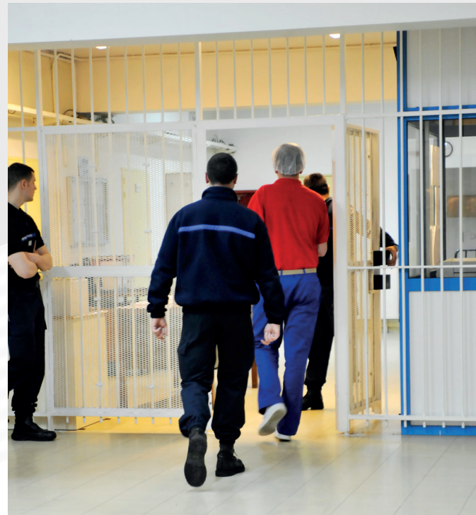
Établissement pénitentiaire de Fresnes

Les surveillants se trouvent ainsi régulièrement pris dans des processus de négociation entre la présentation de soi en tant que professionnel dans la tenue de son rôle en détention et l'identité sensible de l'individu derrière le masque : « C'est vrai qu'on aurait tendance à se dire « Lui il a fumé du chichon c'est rien... Par contre lui il a violé trois enfants et il les a à moitié désossés et jetés dans le lac... » Forcément que le regard est différent. Alors qu'il ne devrait pas l'être. C'est la nature humaine ! Mais il faut parfois passer outre sa nature humaine pour que les choses avancent et que tout se passe bien ! » 21 Une frontière de l'ordre du positionnement intrapersonnel qui s'ajoute à celles présentées précédemment et confirme l'idée que les rapports entre personnels de surveillance et personnes détenues sont parmi les plus complexes du théâtre carcéral.