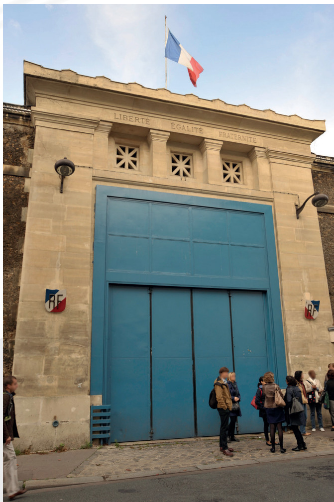
Vue extérieure de la porte d'entrée de la Maison d'Arrêt de la Santé

Questionner les rapports entre personnels de surveillance et personnes détenues n'est pas chose aisée. D'abord, parce que les personnes concernées ne semblent pas toujours à l'aise avec l'idée d'en parler. Ensuite, parce qu'il est toujours difficile de mettre des mots précis sur ce qui se passe entre deux personnes, dans l'espace intermédiaire de l'interaction, dans lequel entrent en jeu de nombreuses logiques et constructions sociales. Enfin, parce que ces relations s'établissent et se développent à l'intérieur d'un dispositif particulièrement complexe, instituant et contraignant : le théâtre carcéral. À travers cette notion et celle de frontière relationnelle, ce texte propose d'explorer de manière synthétique les degrés d'engagement relationnel dont personnels de surveillance et personnes détenues peuvent, ou ne peuvent pas, faire l'expérience dans le contexte carcéral. Le propos se centrera sur les perspectives vécues par les surveillants. Les réflexions proposées sont tirées d'une recherche empirique conduite au centre de détention (CD) de Bapaume et à la maison centrale (MC) de Vendin-le-Vieil en 2016 1 .