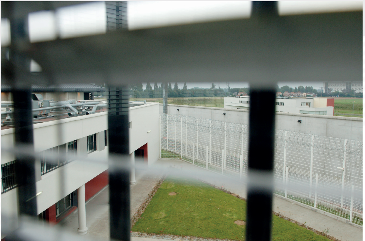
Maison d'arrêt de Lille-Sequedin

de commun qui relie les personnels entre eux, ça donne une appartenance » 12 . Intégré par l'ensemble des acteurs comme une barrière à la relation, l'uniforme est vraisemblablement le premier masque que doivent présenter les personnels de surveillance dans le théâtre carcéral. Il représente le rôle de surveillant autant qu'il le constitue tant il semble orienter le positionnement à adopter en détention : « [il] facilite l'exercice de sa mission en aidant le surveillant à tenir sa place en l'invitant à avoir une attitude digne de l'uniforme qu'il porte » 13 . Il sert alors également à distinguer les surveillants des autres acteurs de l'administration pénitentiaire ; des distinctions de rôles qui pèsent sur les formes possibles (admises) d'être en relation avec les personnes détenues :